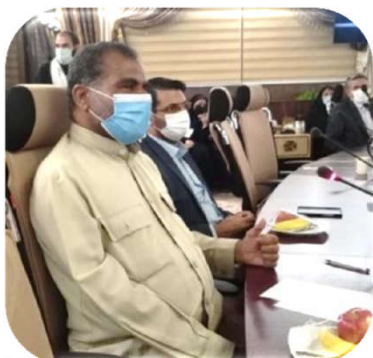
سردار رونده (مشاور فرمانده نیروی سپاه قدس) پنل اربعین، مکتب شهید سلیمانی و تمدن اسلامی