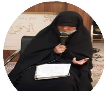
سرکار خانم هنرمند

انسان شناسی در ۲ قسم است: ماقبل مدرنیسم از منظر فلسفه و عرفان، و بعد مدرنیسم که از منظر تجربه و بر اساس یک افسانه است. انسان محوری، از ویژگی های مدرنیته در جامعه است و خود این، موجب خودفراموشی در انسان می شود. انسانی که به عوالم بالایی خودش توجه نکند، تبدیل به شیء می شود. ارکان «انسان مدرنیته» چنین است: ۱. خلوت گریزی: از هر چه او را به عالم غیب دعوت کند می ترسد، چون عذاب وجدان دارد. چرا؟ چون یادش می افتد با خدا قهر کرده. ۲. مصرف زدگی. ۳. اصالت لذت. ۴. راحت طلبی: انسان مدرنیته اختراعات بشر را به استخدام می گیرد تا ذره ای سختی نکشد. ۵. علم زدگی. چه ارتباطی با اربعین دارد؟ دشمن می گوید چطور از مسلمانان، حسین را بگیریم؟ سبک زندگی شان را تغییر دهیم. تغییر سبک زندگی، باعث تغییر طرز تفکر می شود. لازمه آن در سبک زندگی غربی، امر به معروف نکردن است، خلوت گریزی است. در جامعه امروز، خط قرمزها را رد کرده ایم و کم کم لیبرال شده ایم. اما در «سیر انفسی»، انسان با کشف «آیات انفسی» در درون خود، به شناخت از خود و خدا و ولیّ می رسد: «من عرف نفسه فقد عرف ربه». مقدمات سیر انفسی، در اربعین محقق می شود. در اربعین، چون جاذبه های دنیایی زندگی مدرنیته نیست، می توان خلوت کرد و به درون خویش سفر کرد. اربعین و پیاده روی آن، برای انسان خودمحور و مدرنیته، قابل باور و هضم نیست. برایش خنده دار است. چرا که هر چقدر به من توجه کردی، از کیفیت تن کم می شود و هر چه به تن توجه کنی، از کیفیت من کم می شود!