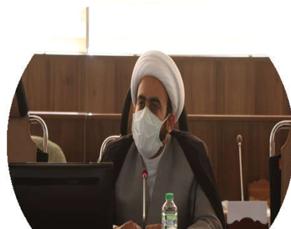
حجت الاسلام دکتر علی الهی خراسانی

از سویی دیگر، تمدن که صورت مادی فرهنگ و وجه بسط یافته و ماندگار و شبکه وار یک جامعه فرهنگی است، بدون دیگری پذیری و دیگری زیستن امکان حیات و بقاء ندارد. برای حرکت در افق تمدنی، باید با «دیگری» به «گفت و گو» نشست.