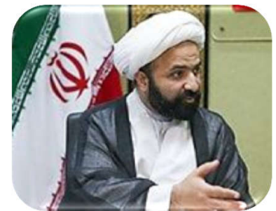
حجه الاسلام محمد سعید اصفهانیان

حضرت آقا در بیانیه، چند جمله کوتاه نیز نسبت به خلاء ها و کمبودها و ظرفیت های مغفول مانده دارند و عمدتا مطالبه گری می کنند. ما باید نسبتی را به سمت افق گشایی ایجاد کنیم و با بخش واقعیت های موجود اجتماعی (که نباید آن را نفی کرد، بلکه افق های گسترده تری را به جامعه نشان داد) جمع نماییم. چون جامعه با توجه به مشکلات عدیده ای که دارد اگر حسش التیام نیابد، نمی تواند به نقشه راه بلندمدت سرزمین ظهور بیندیشد. این نگاهی است که باید بین نگاه اندیشه ورزانه و دغدغه های بدنه جامعه اتفاق بیفتد، امیدآفرینی از این منظر قابل توجه است.