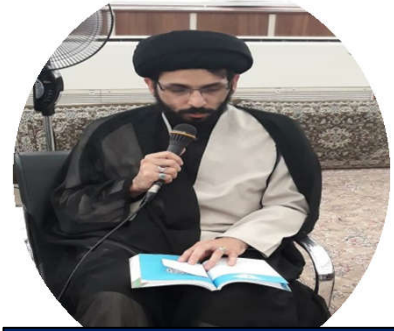
حجت الاسلام سید محمد حسین راجی

۷. بیان ظرفیت ها؛ ما از ظرفیت های طبیعی و انسانی مان (به ویژه جوانان و نخبگان) استفاده نکرده ایم. این هفت عامل باید باعث ایجاد حرکت عمومی در جامعه شود. در اربعین باید یک حرکت عمومی به سوی عدالت، معنویت، ظلم ستیزی و... ایجاد شود.