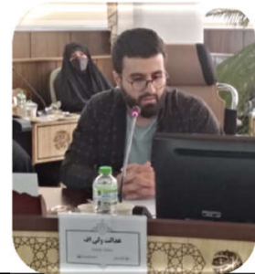
عدالت ولی اف

می خواهم بگویم خدا این نعمت بزرگ را به ما داده است. من که یک طلبه ساده هستم و آمده ام این جا درس می خوانم، شما باید به من کمک کنید. شما باید بگویید چه کارهایی می توانیم بکنیم؟ اگر از این نعمت، ما خوب استفاده نکنیم، خدا روز قیامت، از همه سوال می کند [که] من به شما نعمت دادم! ما همچنین چیزی در دنیا ندیدیم [که] ۲۵ میلیون انسان جمع بشوند به خاطر یک هدف. هیچ جا ندیدیم. اربعین واقعا خیلی نعمت بزرگی است. برادرانم خیلی حرف های خوبی می زنند، ولی آن چیزی را که بخواهیم اربعین را در دنیا و جهان آن طوری که هست نشان دهیم، روش هایی را به ما تفهیم نمی کنند.