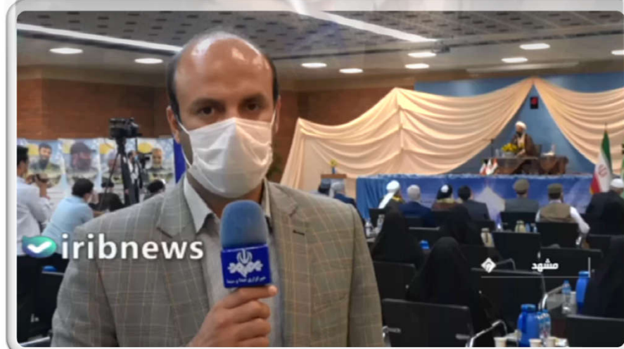
نمونه ای از پوشش تلویزیونی اختتامیه هشتمین کنگره بین المللی اربعین