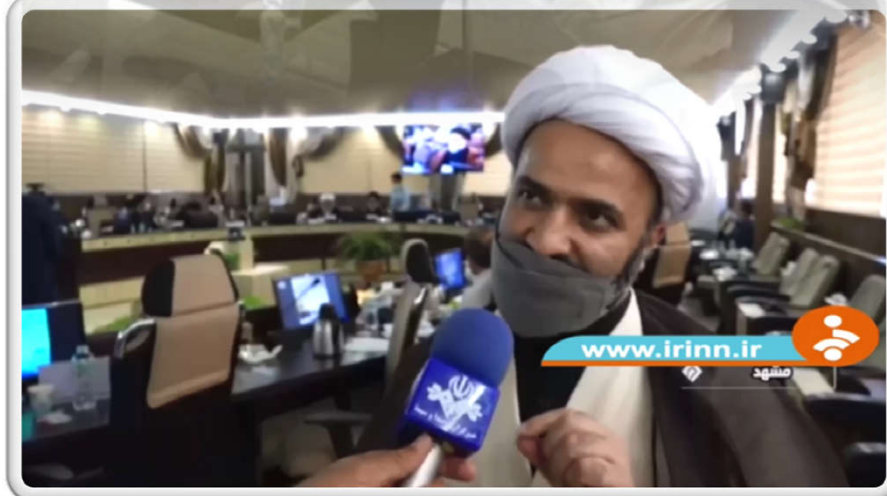
نمونه ای از پوشش تلویزیونی نشست هشتمین کنگره بین المللی اربعین