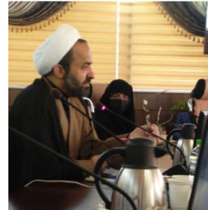
حجت الاسلام دکتر

و آخرین نکته: اربعین نه فقط می‌تواند به مصاف تک تک عناصر فرهنگی مدرن جهانی برود، بلکه می‌تواند یک راه ایجابی و یک آینده متفاوت، آن‌چه که احياناً امروز بشر در موردش فکر نکرده، مثل نظام خادم و زائر که برای انسان مدرن امروزی اصلاً مفهوم نیست، ایجاد کند و به تعبیر تمدنی‌ها، قلمروی پرستیژ تمدنی اسلامی را گام به گام توسعه دهد به توفیق الهی.