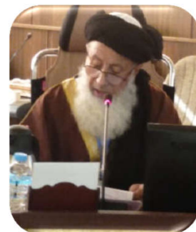
سید حسین احمد شرودی

اما برادران و خواهران! در موضوع اخیر، ما دو نوع امت هستیم؛ امت اجابت و امت دعوت. اولاً می بایست امت اجابت را بر اساس دین شکل دهیم. هنگامی که در آیات قرآن مجید تفکر می کنیم می بینیم که استنباط بعضی از برادرانمان از آیه ای که دیشب تلاوت شد «ان الذین آمنوا و الذین هادوا و النصاری» نسبت به این که یهود و نصارا و امثالهم همگی از ما هستند و این که از ایشان به امت توحید یاد کردند، کلام مستحکمی نیست! زیرا برخی از آیات قرآن، برخی دیگر را تفسیر می کند. قرآن ما را به این موضوع هدایت می کند که یهودیان، دشمنان خدا و رسول اند و دشمنان امت مسلمان! نمی گویم شایسته است که می گویم لازم است برای ما که ایشان را به سوی خداوند و خاتم انبیاء و به سوی دین اسلام دعوت کنیم، زیرا پس از بعثت پیامبر امی، ادیان در زمان او منسوخ گردید به جز دین حق! چنانکه شیخ سعدی شیرازی بیان فرمود که: نه از لات و عزی بر آورد گرد، که تورات و انجیل منسوخ کرد و آخر دعوانا ان الحمد لله رب العالمین.