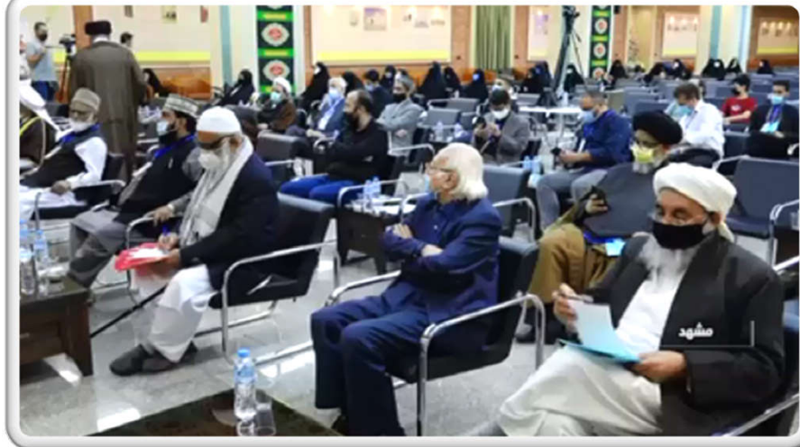
نمونه ای از پوشش تلویزیونی افتتاحیه هشتمین کنگره بین المللی اربعین